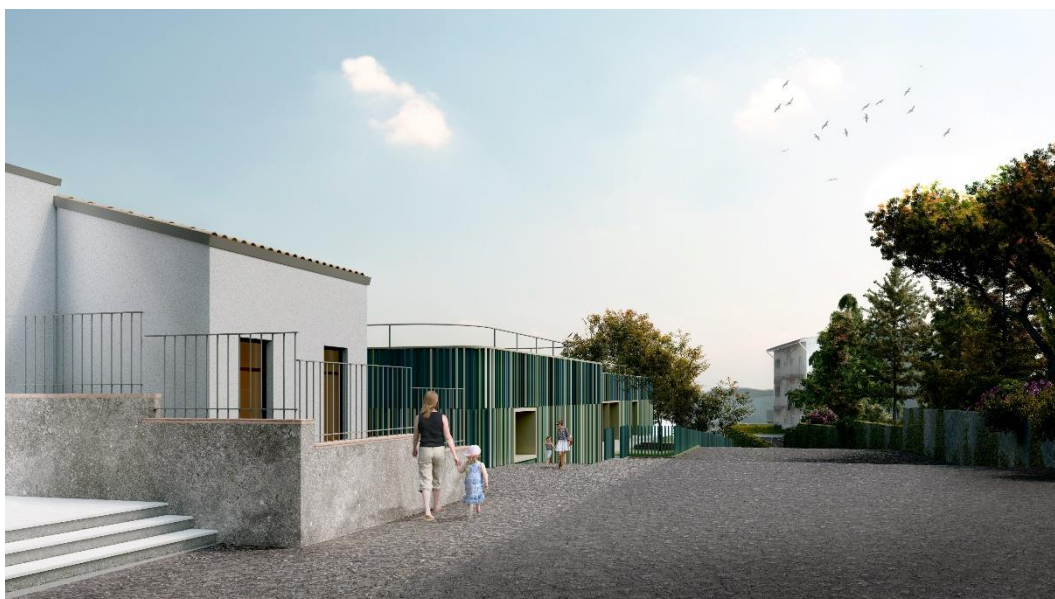
Vista dalla via Carmelo Virga – progetto