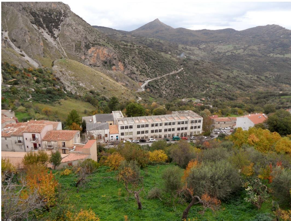
Veduta dall'alto – stato di fatto