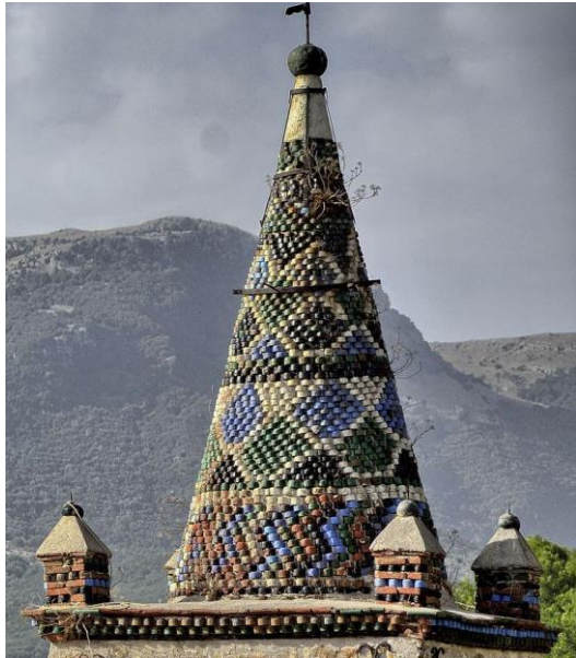
Guglia della chiesa di Santa Maria Maggiore a Isnello

In particolare è stata effettuata una campionatura delle cromie presenti nelle decorazioni in maiolica delle guglie di Isnello ed estratta una gamma di colori che variano dal giallo, al verde, al blu.