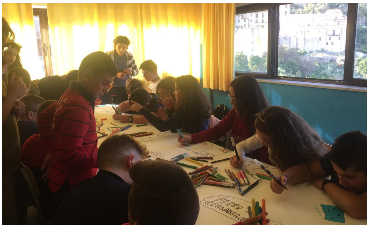
Momento di lavoro con i bambini della scuola primaria di primo livello