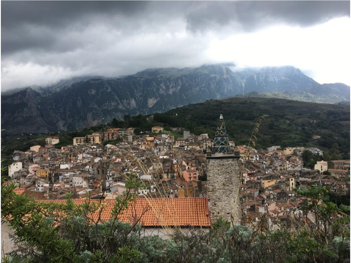
Veduta di Isello

Per migliorare ulteriormente l'integrazione del nuovo edificio, il progetto prevede la sistemazione in copertura di un tetto giardino estensivo dal basso carico manutentivo e dall'alto valore di mitigazione ambientale.