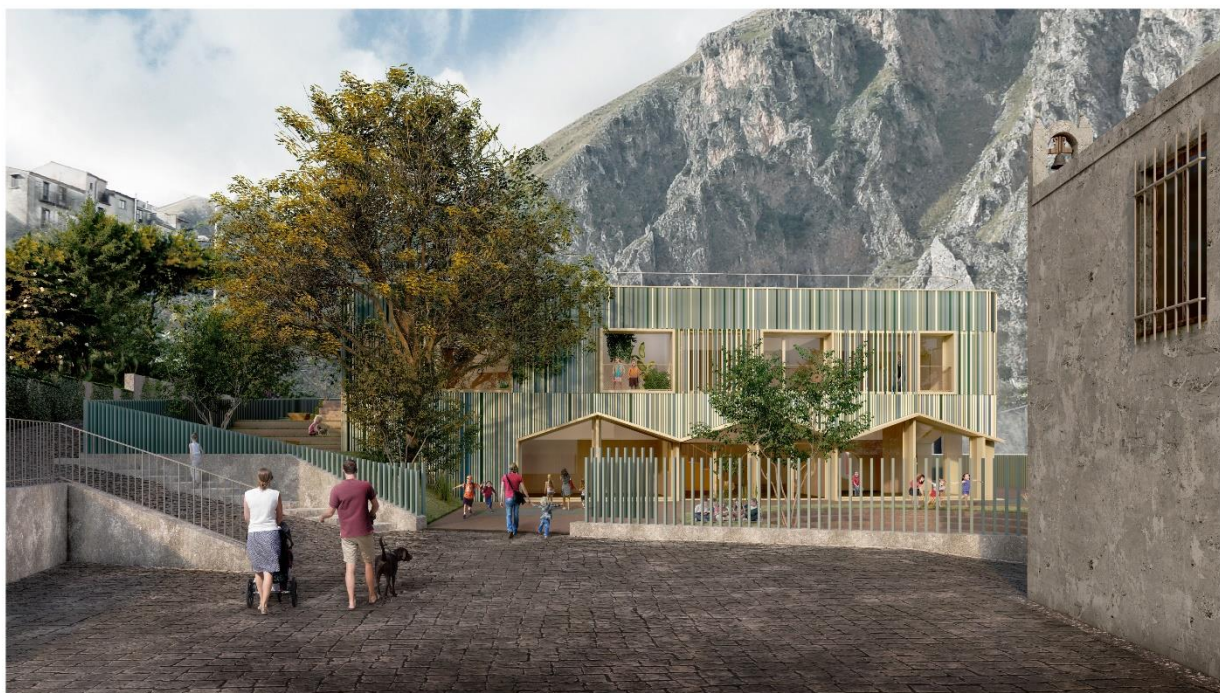
Vista dalla piazzetta della chiesa di Santa Lucia – progetto