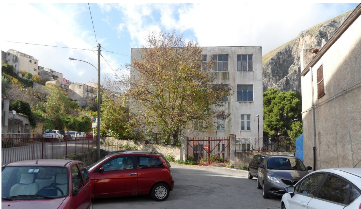
Vista dalla piazzetta della chiesa di Santa Lucia – stato di fatto