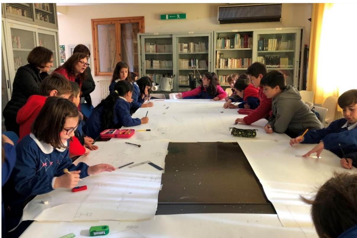
Momento di lavoro con i bambini della scuola elementare

Con la stessa finalità del questionario, il laboratorio di progettazione partecipata ha previsto la realizzazione di una fase laboratoriale interna alla scuola, gestita in collaborazione con il corpo docenti dell'istituto , che ha coinvolto in maniera attiva e diretta tutti i 101 bambini frequentanti l'edificio.