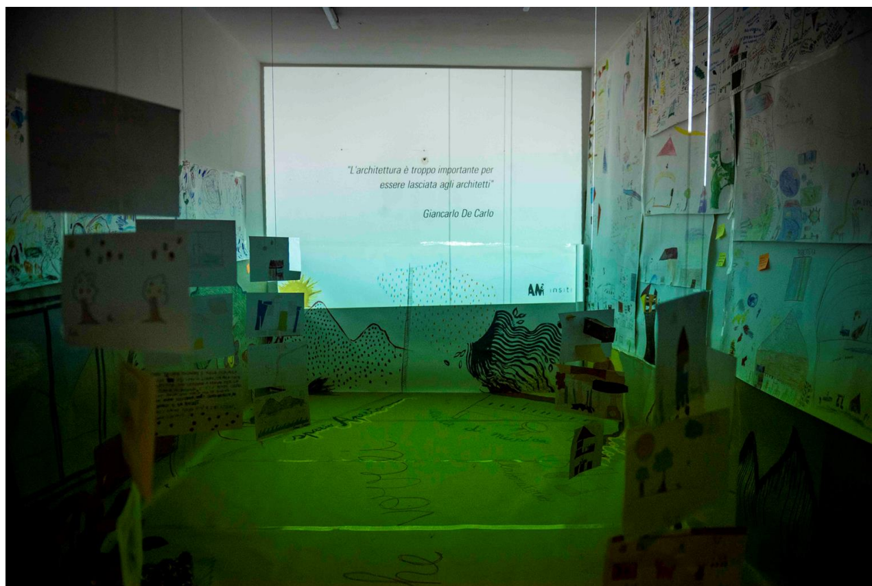
Allestimento Mostra "la scuola che vorrei"