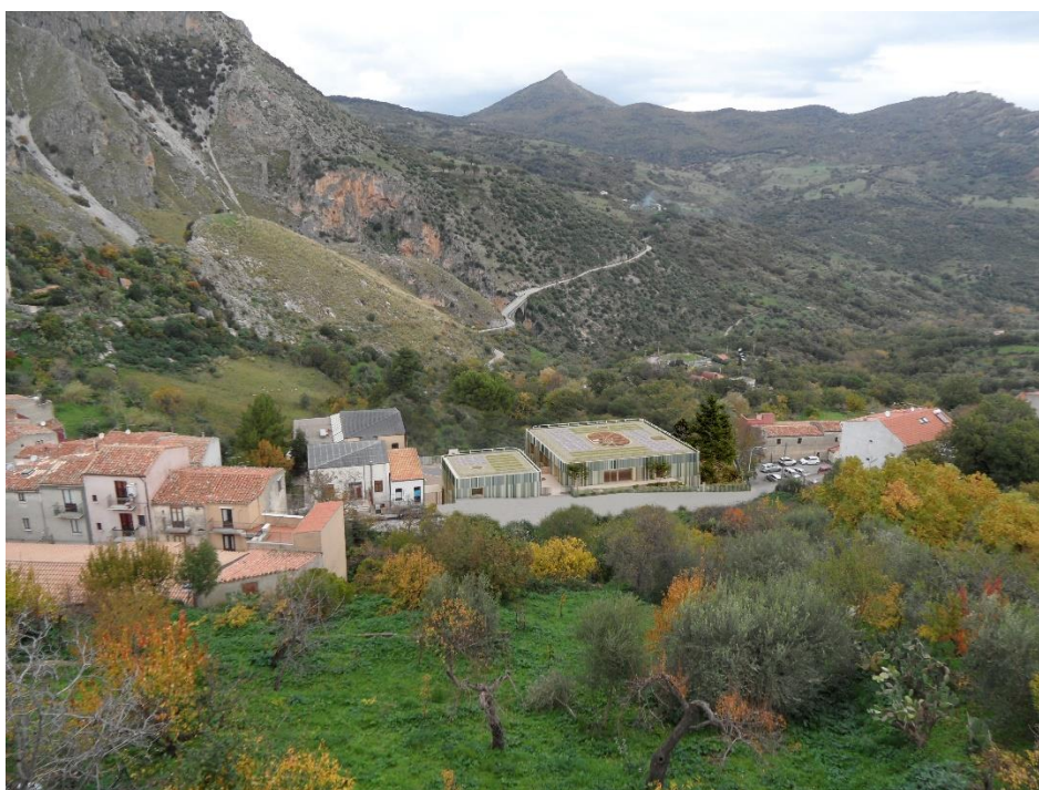
Veduta dall'alto – progetto