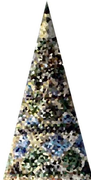
Definizione della palette di colori

Inoltre, il processo partecipativo e le attività legate ai sondaggi effettuati mostrano come le cromie che la comunità si aspetta dal nuovo edificio scolastico, spaziano all'interno della gamma che va dai blu ai verdi.