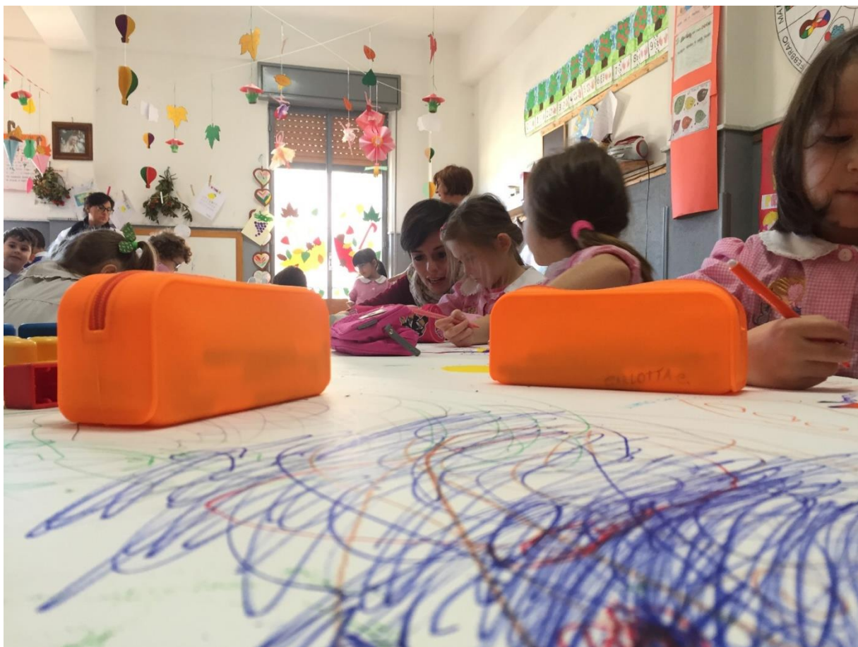
Momento di lavoro con i bambini della scuola materna