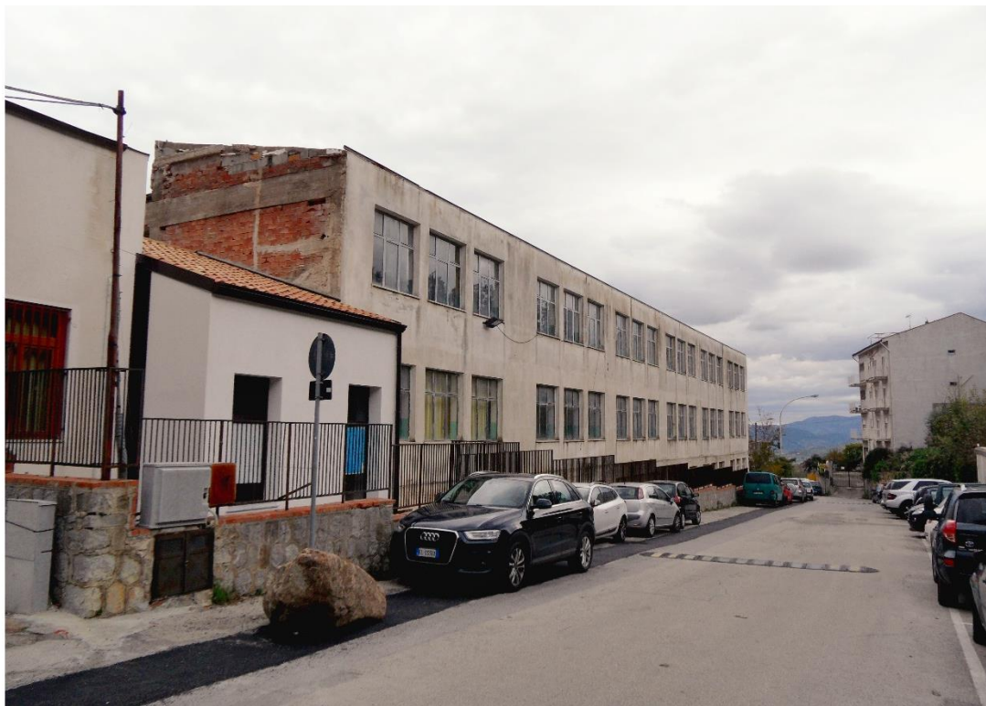
Vista dalla via Carmelo Virga – stato di fatto

pensilina leggera in elementi metallici, indipendente dal nuovo edificio, conduce alla palestra esistente. La palestra e i locali annessi saranno sostanzialmente mantenuti nella distribuzione e recuperati nelle finiture e negli impianti.