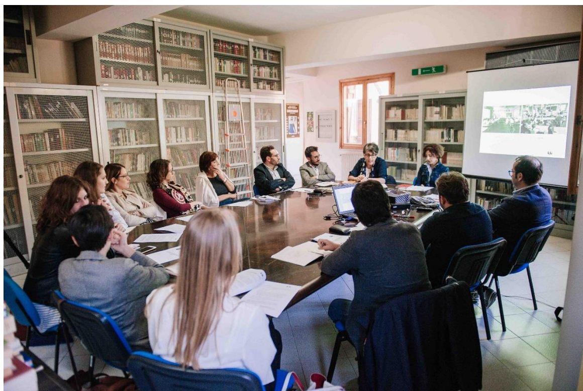
Incontro di StartUp del percorso di partecipazione

Dal dibattito sono emerse numerose indicazioni utili all’impostazione generale del progetto, come ad esempio la scelta fondante su cui si articola il progetto architettonico della nuova scuola e che ha portato all’individuazione di due plessi con accessi separati (materna e blocco elementare/secondaria di primo livello) tenuti insieme però internamente dagli spazi comuni a tutti.